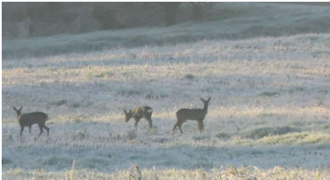
Chevreuils, lieu-dit Chez Landreau

L'association compte 17 adhérents titulaires d'une carte dont 4 Mérignacais .