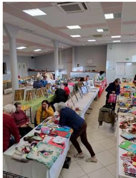
Marché de Noël, dimanche 5 novembre 2023.

L'association organisera un repas, ouvert à tous, le samedi 10 février 2024.