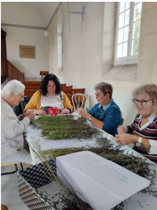
Atelier : fabrication de bouquets de lavande.